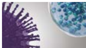
nanoe™ X når föroreningarna.

Tack vare egenskaperna i nanoe™ X kan flera typer av föroreningar inaktiveras, däribland vissa bakterier, virus, mögel, allergener, pollen och skadliga ämnen.