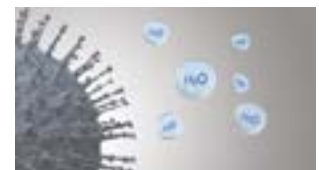
Föroreningarnas aktivitet hämmas.